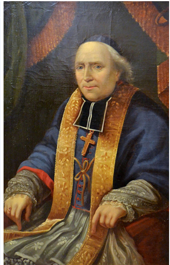
Mgr de Bienvenu de MIOLLIS (1753 - 1843)